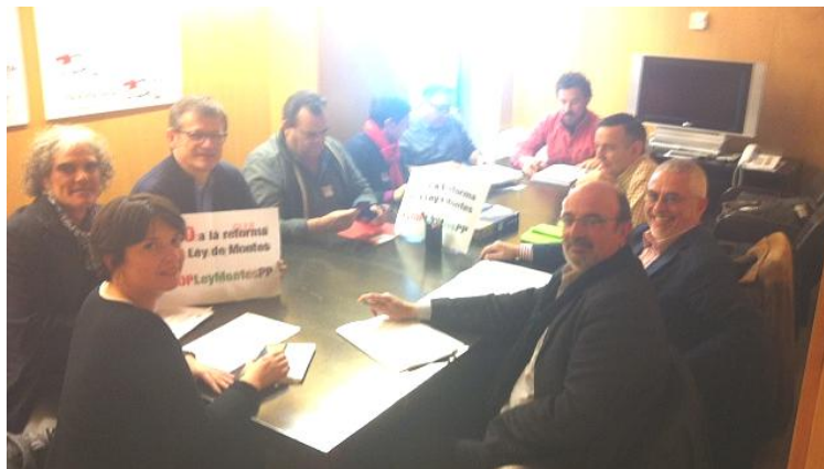
Reunión de CCOO con la Izquierda Plural para abordar la Ley de Montes