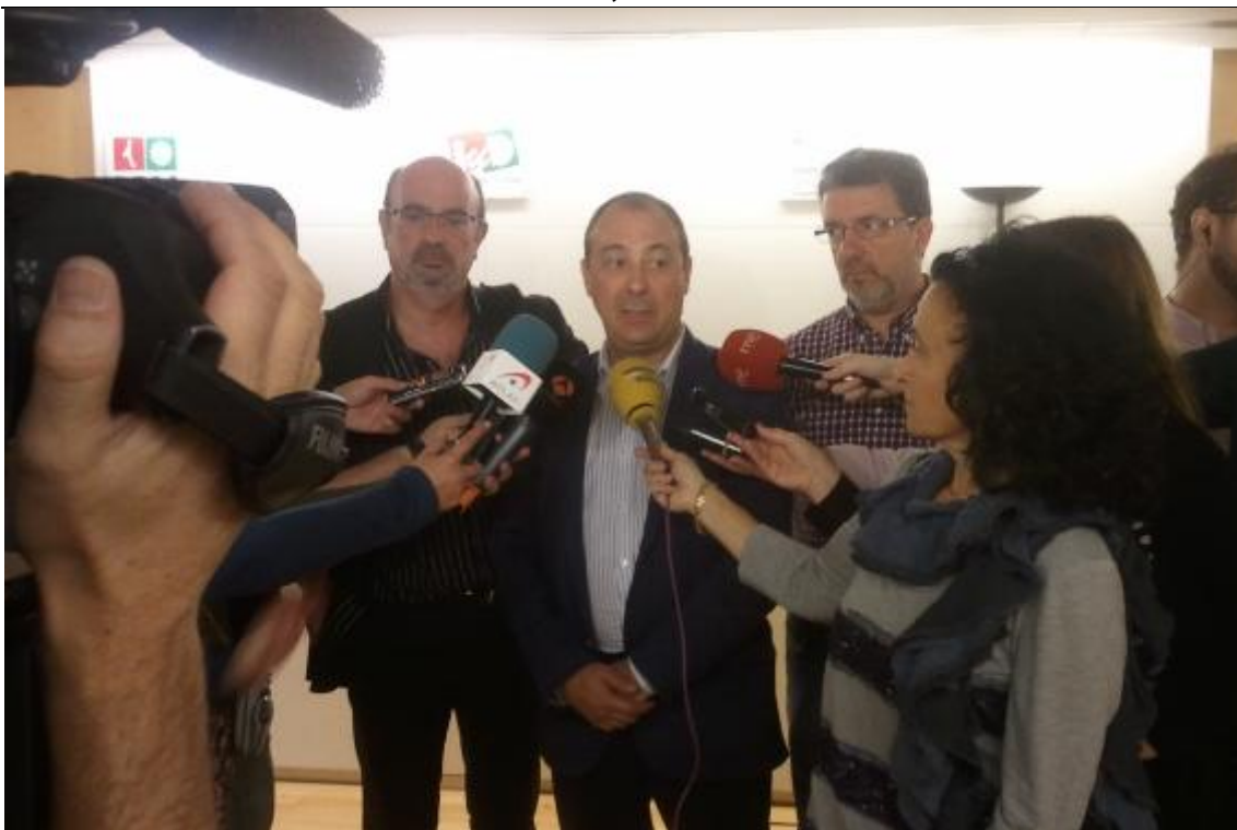
Representantes de CCOO atendiendo a la prensa tras su reunión con IU

Nº 137 / Año II – Martes, 4 de noviembre de 2014