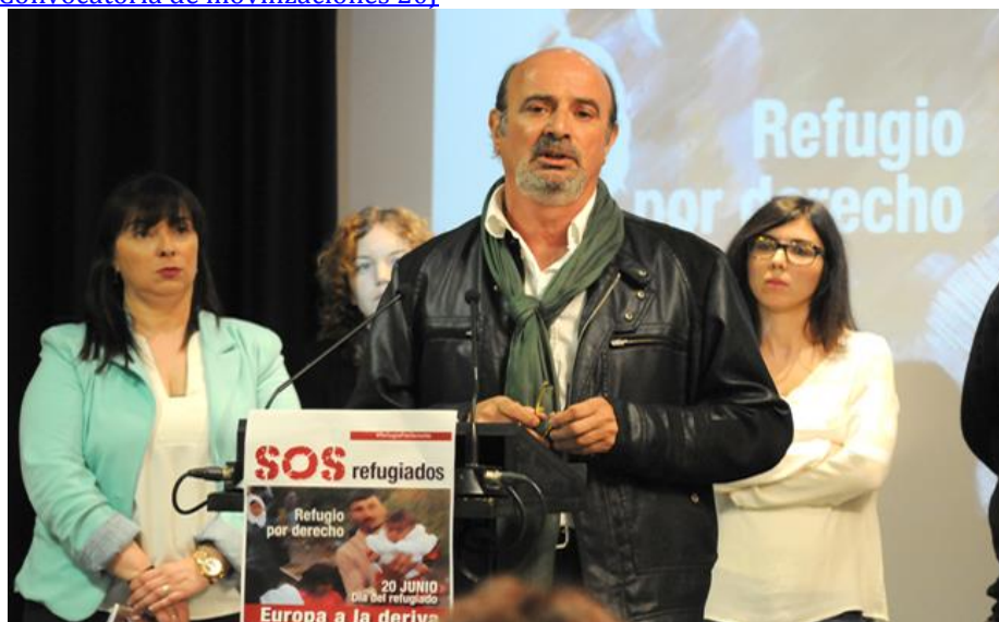
Acto, celebrado en Madrid, de presentación del manifiesto de apoyo a los refugiados (11/5/2016)