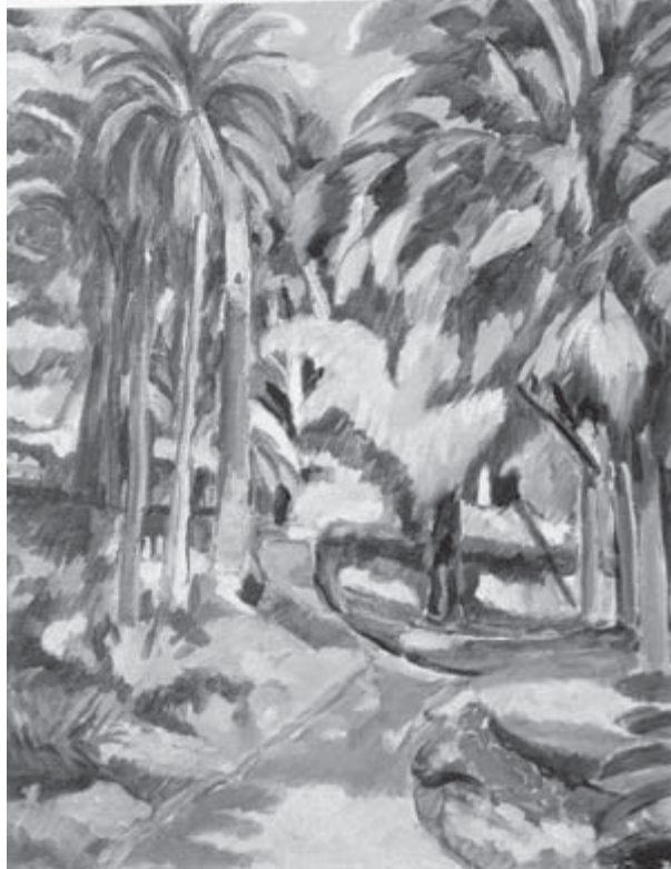
Camino entre palmeras , Francisco Iturrino

Los retos a los que se enfrentan los sindicatos son numerosos. Van desde la organización en entornos cada vez más diversos, y a veces hostiles, hasta la tarea de proteger los derechos sindicales básicos, a tratar con las empresas multinacionales, ocuparse de las relaciones laborales atípicas y hacer frente al fenómeno de la globalización. Para enfrentarse a estos retos, la nueva CSI intenta fortalecer su impacto a nivel nacional y su capacidad para diseñar estructuras internacionales cuya influencia afecte a todos.