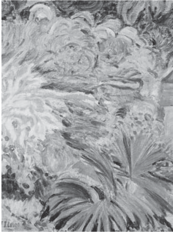
Jardín , Francisco Iturrino

Los sindicatos como agentes de cooperación internacional al desarrollo tardaron en ser reconocidos, a pesar de que para hacer posible la legítima defensa de los derechos laborales y sindicales es imprescindible la existencia de organizaciones sindicales sólidas y democráticas que actúen en marcos de independencia y libertad. Mas allá de las incomprensiones que todavía hay que salvar, es difícil obviar la capacidad de organización y de estructuración social, lo que convierte a los sindicatos en instrumentos de vertebración social y democratización política y económica.