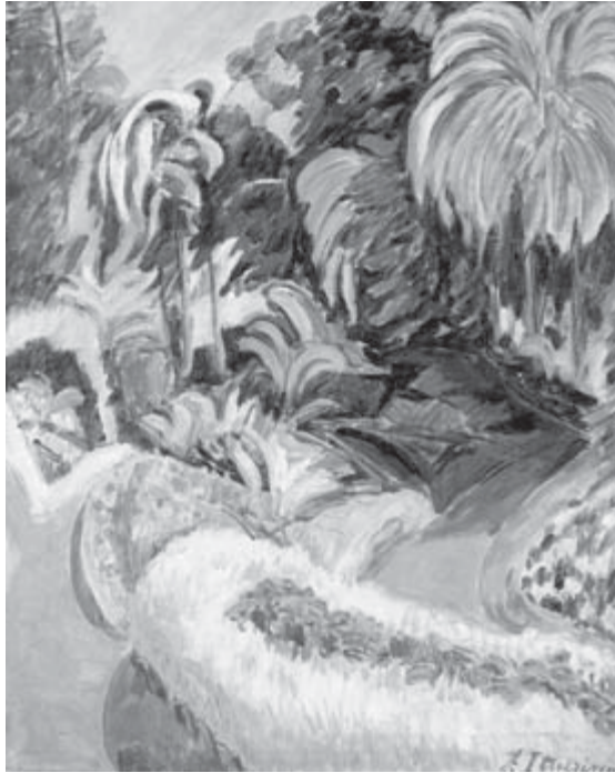
Jardín , Francisco Iturrino

Los sindicatos necesitan avanzar más en el proceso de centralización organizativa, a través de la creación de uniones y confederaciones por sectores y ramas. La supervivencia de sindicatos de empresa en esta región es una gran rémora. Pero esas transformaciones deben dar a políticas organizacionales concretas, a través de instrumentos de medición de progresos en la modernización y la autonomía sindical. Un gran desafío sindical es establecer el nexo entre las transformaciones sindicales y la política, esa estrategia que refuerza la importancia de vincular la unidad, las propuestas y objetivos programáticos de la PLA (...) Pero los avances sindicales sólo serán sólidos si el sindicalismo latinoamericano logra colocarse a la altura de los nuevos desafíos político laborales y sigue marchando decididamente a concretar la unidad sindical continental.