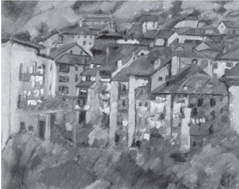
Motrico , Francisco Iturrino

Las centrales sindicales pueden convertirse en reliquias del pasado o erigirse en fuerzas del futuro. Tienen enormes retos: conquistar y defender su autonomía; asegurar un funcionamiento democrático que refuerce su legitimidad; aumentar su representatividad y desarrollar sus capacidades de análisis y de proposición. Además, tienen el desafío de entablar un diálogo constructivo y lograr una articulación con el resto de la sociedad civil, esencial para contribuir a la democratización de sus países. Finalmente tienen que asumir la interdependencia sindical para afrontar cuestiones como las migraciones o la transnacionalización de las empresas. Por todo ello, sindicatos europeos y magrebíes insisten en la urgencia de la creación de un marco de diálogo social euromediterráneo entre los países del sur y los países europeos, implicando a gobiernos, patronales y organizaciones sindicales.