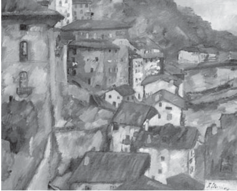
Pueblo sobre el puerto (Motrico) , Francisco Iturrino

Las mujeres constituyen el 52% de la población europea, en otras palabras, la mayoría. Sin embargo, siguen sufriendo discriminaciones en muchos ámbitos de la sociedad y donde más en el mundo del trabajo. Para suprimir las trabas que siguen obstaculizando el acceso de las mujeres al mercado laboral se requieren acciones más concretas, y muy especialmente en relación a la conciliación entre vida laboral y familiar, el acceso a la formación y la participación de las mujeres en los cargos directivos.