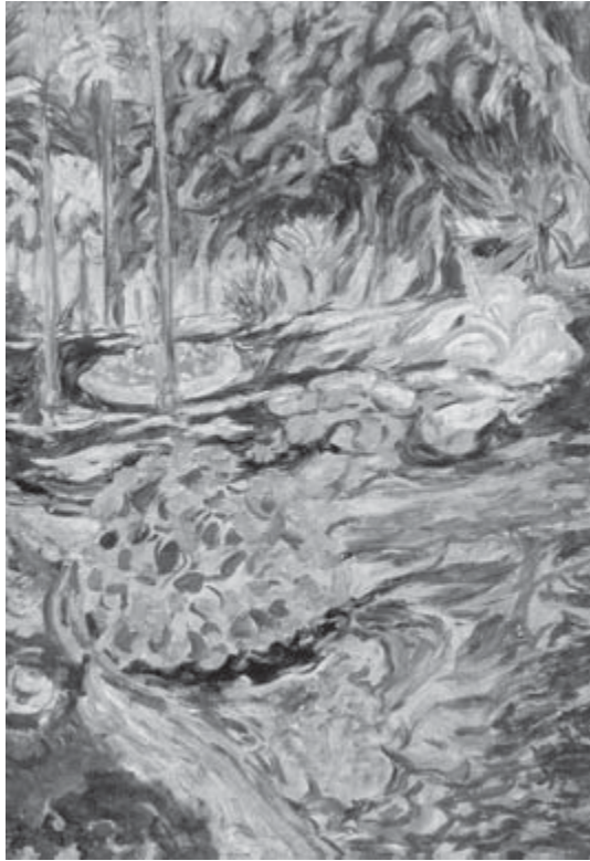
La concepción (Málaga). Francisco Iturrino

La tarea de coordinación frente a las negociaciones y acuerdos del sindicalismo euro-latinoamericano es responsabilidad de la Confederación Europea de Sindicatos y de sus equivalentes latinoamericanos. Pero esto es sólo una parte del compromiso sindical europeo en América Latina. El grueso de la actividad sigue centrada en las laborales de solidaridad y de cooperación, donde son las confederaciones nacionales europeas y sus institutos quienes, desde hace muchos años, están contribuyendo a reforzar al sindicalismo latinoamericano en contacto con la CSI.