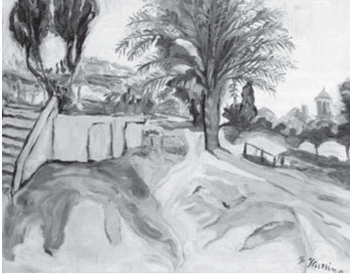
Paisaje , Francisco Iturrino

Si la alternativa sindical a la globalización de los mercados es encontrar un terreno adecuado, hay que ganar la batalla de las ideas para demostrar que es posible gestionar el cambio en las empresas, las industrias, las regiones y los mercados laborales de una manera socialmente equitativa. Hay que desarrollar un «modelo» de organización industrial que sea a la vez competitivo y socialmente aceptable.