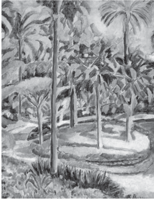
Jardín , Francisco Iturrino

El futuro está plagado de incertidumbres. Podemos incluso decir que en el comienzo del siglo XXI la era de la globalización es también la era de la incertidumbre. ¿Por qué? Sobre todo porque todavía no se han conformado instrumentos de gobierno mundiales y regionales que hagan frente con coherencia y capacidad de resolución, a los grandes problemas que tiene la humanidad.