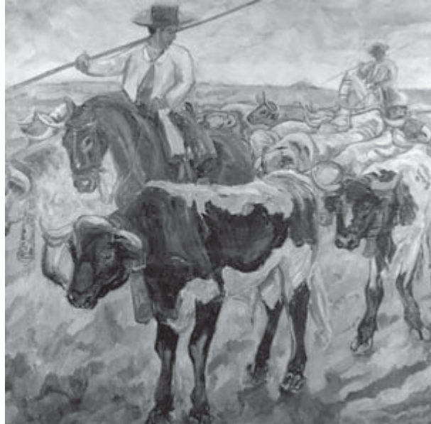
Escena campera , Francisco Iturrino

Desarrollo sostenible, lucha contra la pobreza y trabajo decente deben formar parte de los programas y agendas de los Gobiernos y de las organizaciones del sistema multilateral, si queremos lograr una globalización justa.