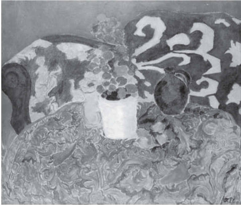
Bodegón , Francisco Iturrino

En el Congreso de la CES celebrado en 1999 en Helsinki el tema central fue la europeización de las relaciones industriales. Haciendo balance en el año 2007, podemos constatar que hemos conseguido importantes avances con vistas a una europeización de las relaciones laborales. A pesar de haber sentado bases importantes en ese proceso, aún nos queda mucho camino por recorrer hasta que Europa se pueda convertir en un auténtico espacio para el diálogo social, las negociaciones colectivas y la participación de los trabajadores.