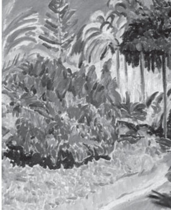
Jardín de Málaga (La concepción) , Francisco Iturrino

En este debate el papel del Derecho Internacional no debe ser nunca minusvalorado, sobre todo en un momento de ciega confianza en los mercados, en la desregulación y en el unilateralismo.