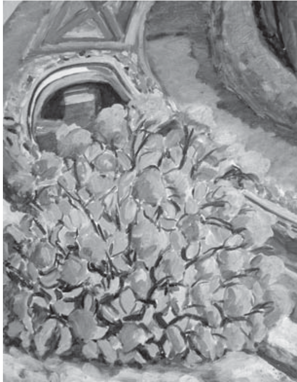
Tartáreas , Francisco Iturrino

En este contexto, la cooperación al desarrollo, en el siglo XXI, se concibe como un mecanismo imprescindible para que el escenario internacional sea más estable, pacífico y seguro para todos los habitantes del planeta.