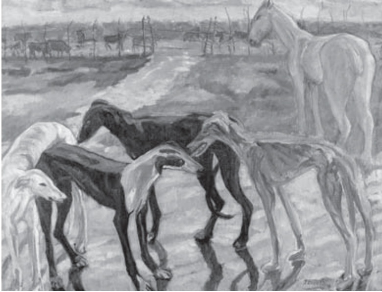
Galgos , Francisco Iturrino

El Congreso fundador de la CSI ha sentado las bases sobre las que se construirá la nueva Internacional sindical. Sus valores serán los de la democracia y de la justicia social para combatir las desigualdades, las discriminaciones... y con el objetivo de transformar las sociedades que nutren esas desigualdades. ¡El trabajo debe primar sobre los intereses del capital!.