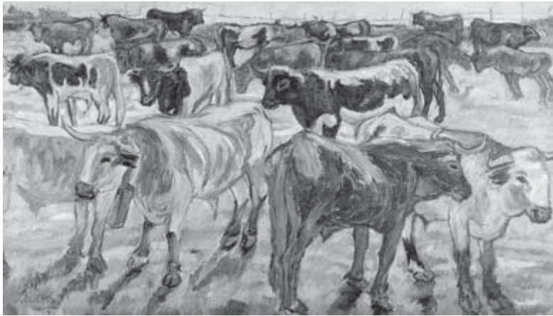
La torada , Francisco Iturrino

La globalización es una imprescindible referencia que plantea al sindicalismo la necesidad de ser tal en el ámbito mundial. En esta exigencia hemos de incluir la necesidad de definir y practicar la voluntad de incidencia sindical en la «gobernanza» mundial.