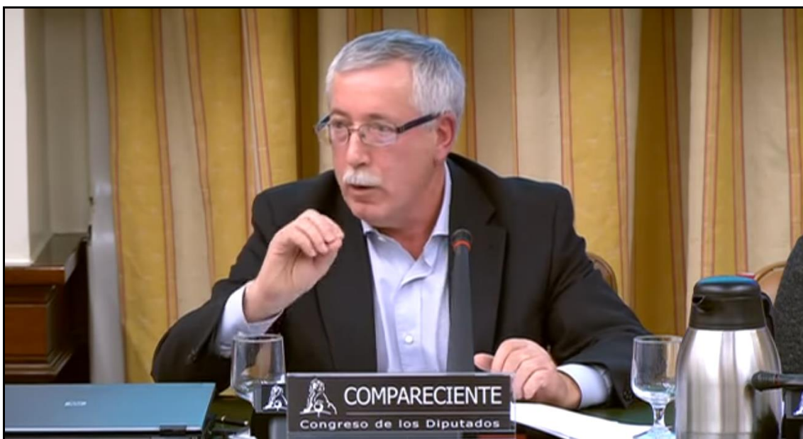
Comparecencia parlamentaria del secretario general de Comisiones Obreras

Nº 231 / Año IV - Viernes, 2 de diciembre de 2016