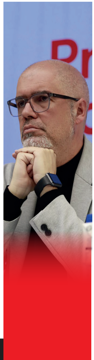
Unai Sordo. Secretario general de CCOO